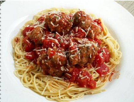
مكرونه الكفتة بالصلصه